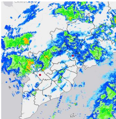
Ảnh radar thời tiết