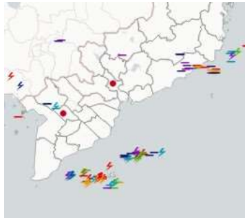
Ảnh định vị sét