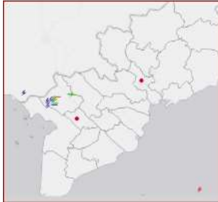
Ảnh định vị sét