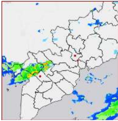
Ảnh radar thời tiết