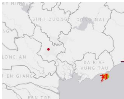
Ảnh định vị sét