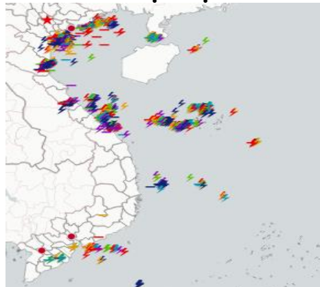
Ảnh định vị sét