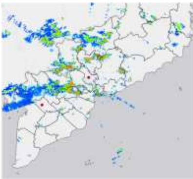
Ảnh radar thời tiết