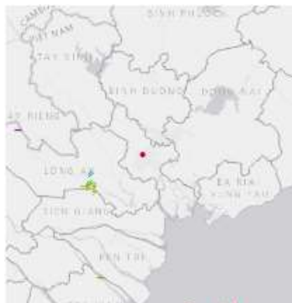
Ảnh định vị sét