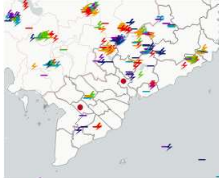
Ảnh định vị sét